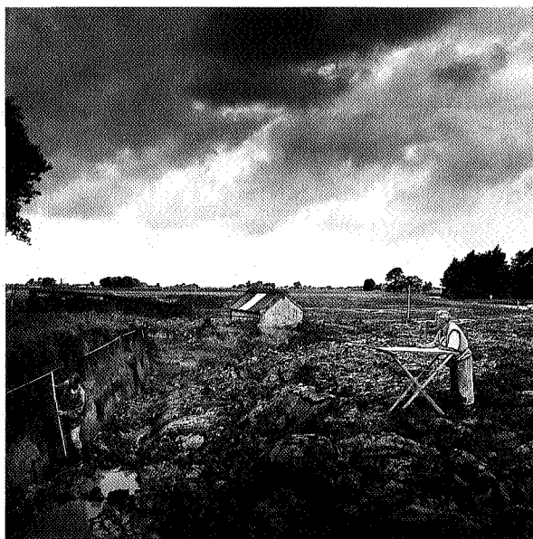
Profielwand wordt in tekening gebracht, foto Ton Broekhuis.

Het aardewerk doet in zijn veelzijdigheid ook zeer militair aan, hetgeen logisch is omdat de enige Romeinen in de buurt militairen waren. Er is echter nog niet mee gezegd dat militairen hier in Winsum voor langere tijd hun bivak opsloegen. Anderzijds: een amfoor met wijn kan zeker een geschenk aan een Fries zijn geweest, maar geldt dat ook voor de vele gevonden amforen voor vissaus of olijfolie? Is zestig liter olijfolie een passend relatiegeschenk voor een Friese boer? En - een andere vondstcategorie - ligt het voor de hand dat het natuurstenen plateautje waarop de legerarts zijn zalfjes aanmaakte, cadeau werd gedaan aan een inheemse collega of de vrouw van het stamhoofd?