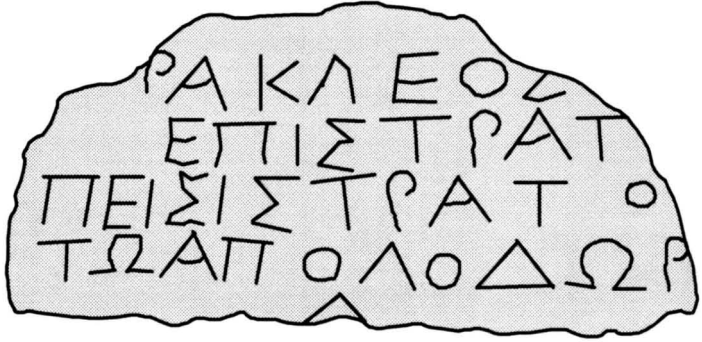
Fig. 3- Dibuix de la inscripció