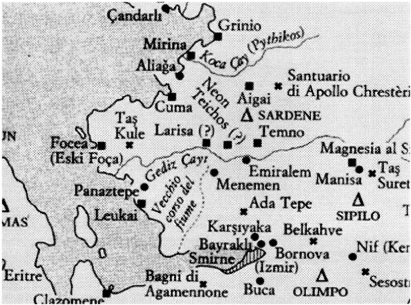
Fig.6-Mapa de la zona limítrofa de les costes Jònica i Eòlica de l'Àsia Menor amb Neon Teikos al bell mig

RAGONE, G: La progredazione costiera nella regione del delta dell'Ermo e la colonizzazione greca nell'area fra Smirne e Cuma eolica . Bari, 2003