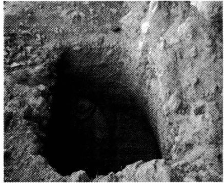
Fig. 1- Ceràmica trobada al bothros