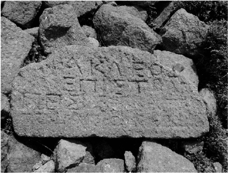
Fig. 4- Fotografia de la inscripció