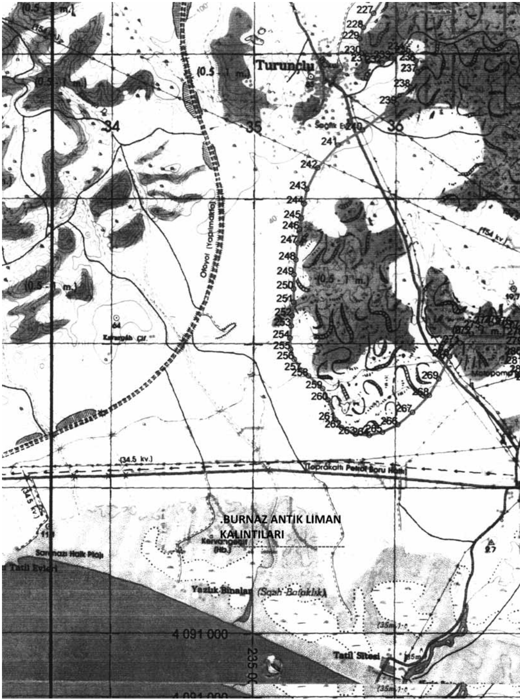
Resim 3: Deli Halil volkanı, antik yerleşimi ve Burnaz antik limanı çevresi yerleşimler.