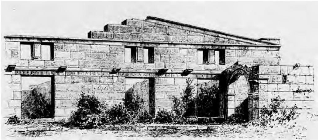
Fig. 3 — Les horrea d'Andriakè (dessin de G. Niemann, 1882).

exceptionnel du lieu 5 . À la suite de cette découverte, Th. Marksteiner 6 , qui dirigeait alors la mission archéologique voisine de Limyra, obtint de la part des autorités turques une autorisation de prospection 7 renouvelée jusqu'en 2009. Mais à cette date, la fouille du site fut brutalement retirée aux archéologues autrichiens et confiée à une équipe de l'université d'Antalya qui a procédé depuis à de vastes dégagements. Quelques rapports de fouille sont parus dans la revue de l'Institut Sinan Kiraç d'étude des civilisations méditerranéennes d'Antalya 8 et le chef de la mission, N. Çevik, a publié succinctement ses travaux dans un livre général sur la Lycie 9 . C'est à partir de ces rapports et d'une nouvelle visite du site, que j'ai effectuée après les dégagements opérés par nos collègues turcs, que je propose aujourd'hui de faire un point des connaissances sur Andriakè et de continuer à réfléchir sur l'importance de ces aménagements portuaires uniques en Asie Mineure.