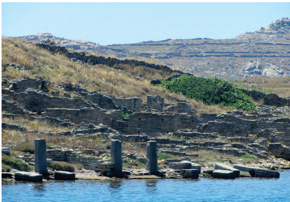
Fig. 7 — Délos : la Pointe des Pilastres.