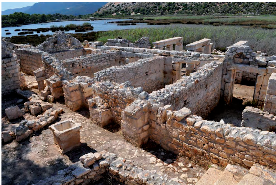
Fig. 5 — Ensemble commercial de la rue du port. Au centre de l'image, les 4 boutiques. À l'avant de celles-ci, le dispositif à piliers.