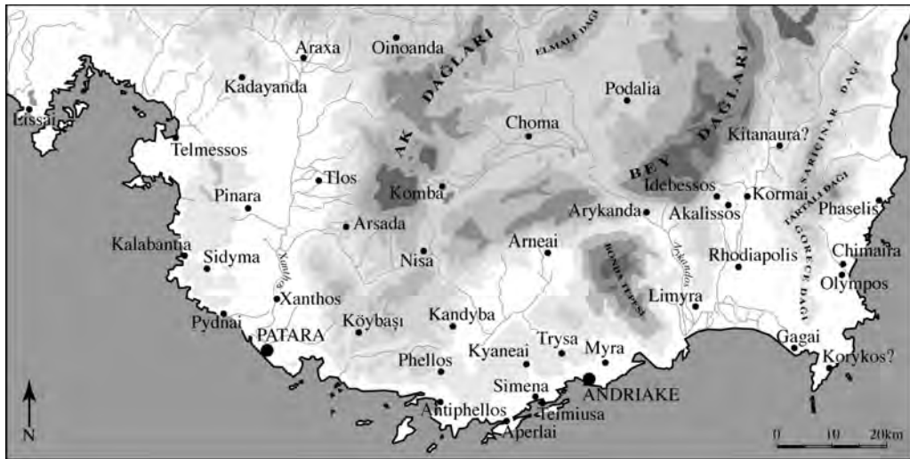
Fig. 1 — Carte de la Lycie antique (DAO N. Peixoto).