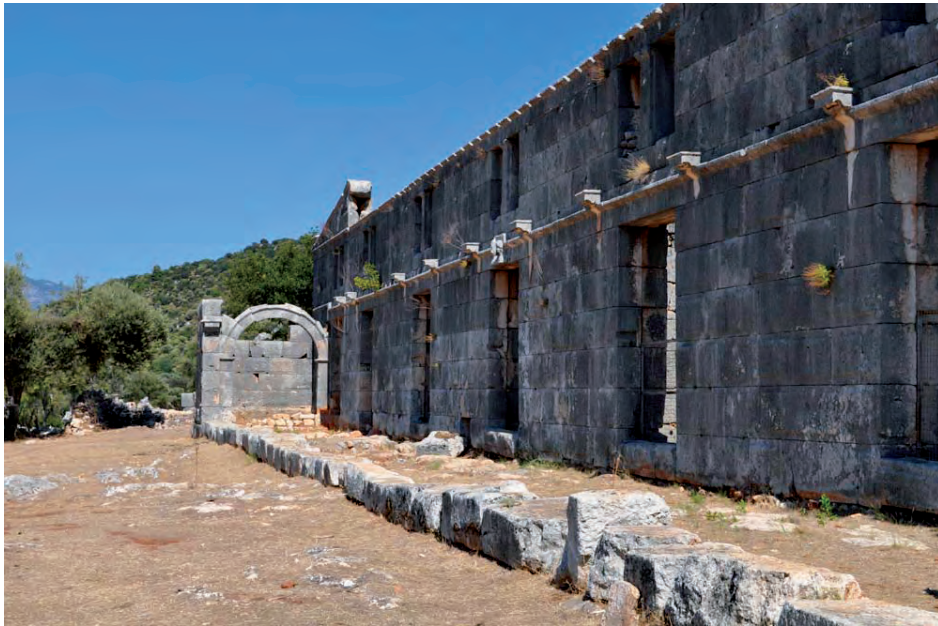
Fig. 4 — Les horrea d'Andriakè, stylobate du portique de façade.

(fig. 4) établie entre les deux pièces latérales et qui court sur toute la longueur de la façade ait servi de stylobate pour un portique, comme c'est le cas, par exemple, aux horrea de Valence 13 . On s'explique moins la présence d'un seuil à proximité de la pièce latérale ouest. Il s'agit peut-être d'une modification tardive.