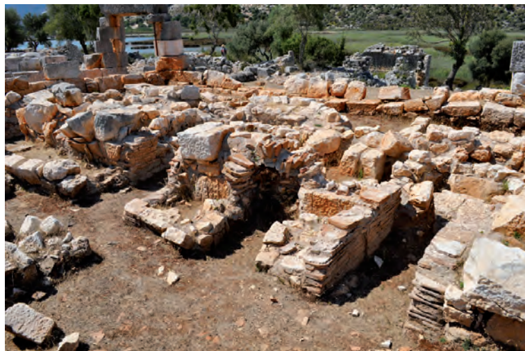
Fig. 9 — Andriakè : fours à murex (cl. Y. Leclerc).

Enfin, comme on l'a vu, une industrie de la pourpre s'est installée à Andriakè, pendant l'Antiquité tardive : d'après les archéologues turcs, on peut dater l'installation des fours à murex (fig. 9) dans les portiques de la place au IV e s. apr. J.-C. Ces fours auraient été détruits au VI e ou au VII e s. et les pièces des portiques auraient été alors remises en service. On notera également la présence sur l'agora d'un grand bassin, peut-être destiné à conserver vivants les coquillages, à moins qu'il ne s'agisse d'une installation pour la teinturerie. Les études de G. Forstenpointner ont montré que la production de pourpre s'est interrompue au VI e s., probablement à cause de la surexploitation de la ressource (coquilles d'individus immatures retrouvées en grand nombre) 30 . Cette industrie typiquement lycienne aura tout de même duré près d'un millénaire.