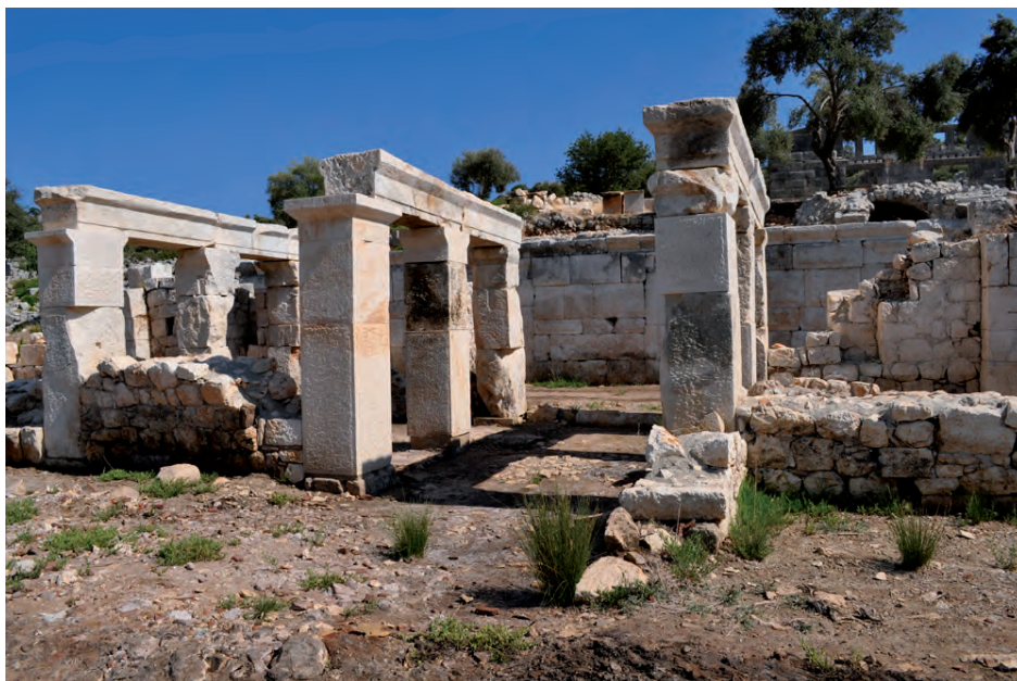
Fig. 6 — Le dispositif à piliers.