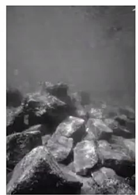
Nieto et al. 2005