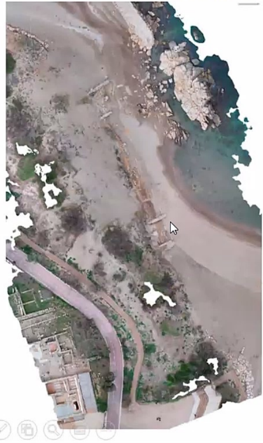
La excavación de la fachada este de la Neápolis.