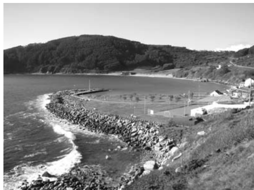
Figura 1 La bahía de Bares, con el Coído en primer término. Al fondo, en el medio de la playa, se encuentra el peñón de Igrexa Vella, donde recientemente se ha excavado una villa romana

La investigación cuya primera fase de trabajo presentamos, patrocinada por el Centro de Estudios Históricos de la Obra Pública y el Urbanismo, se planteó con una doble intención: aproximarnos al origen del dique y estudiar la recuperación y protección del Coído como bien patrimonial. Para ello, se constituyó un equipo de trabajo compuesto por especialistas en historia, arqueología, geología e ingeniería de costas,