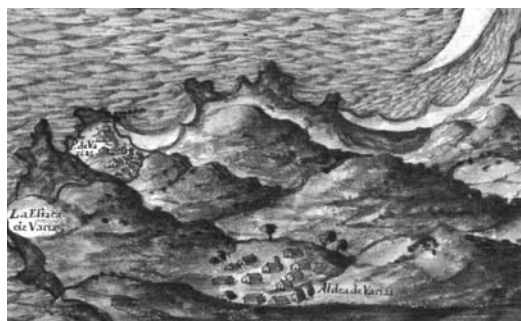
Figura 2 Detalle de la lámina correspondiente a las rías de O Barqueiro y Viveiro en la que se representa el Coído de Bares. (Texeira Albernas, P. [1634] 2002)

La primera representación gráfica del Coído de Bares se remonta al año 1634. Pedro Texeira Albernas, en su obra cartográfica «La descripción de España y de las costas y puertos de sus reinos», lo dibuja esquemáticamente como una alineación de escollera redondeada (fig. 2). Desde entonces, con mayor o menor detalle, en planos y cartas náuticas el dique ha sido representado como una acumulación de bolos que abriga el puerto de Bares.