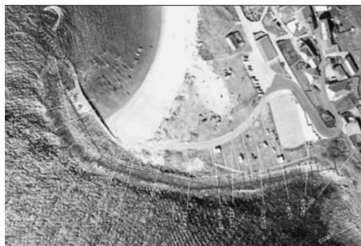
Figura 8 Comparativa entre el perfil de 1898 (fucsia) y el medido en campo para este trabajo (blanco)

Los parámetros fundamentales, medidos en agosto de 2006, que definen al dique son los siguientes: (1) longitud total del eje o coronación del dique, proyectada sobre el plano horizontal y medida desde el arranque, 292 m; (2) valor promedio de la cota de cresta a lo largo de su longitud: 6,61 m sobre la BMVE; (3) volumen de escollera por encima del NMM: 20.000 m 3 ; (4) volumen total de escollera: 70.000 m 3 ; (5) peso medio de la escollera: 900 kg; (6) peso de los bolos: entre los 6 kg y las 6 toneladas.