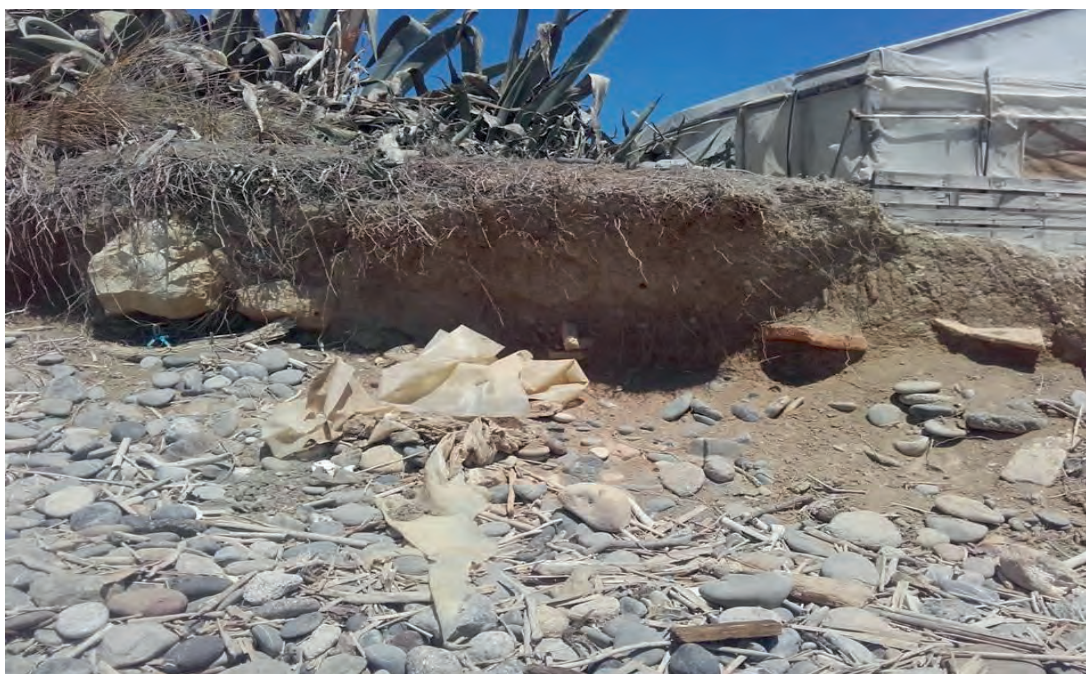
Εικ. 3: Εικόνα του πρανούς στον όρμο του Στομίου, όπου εντοπίζεται η τομή λιθόκτιστου τοίχου και τμήματα στρωτήρων κεράμων, πιθανότατα, ρωμαϊκής χρονολόγησης.