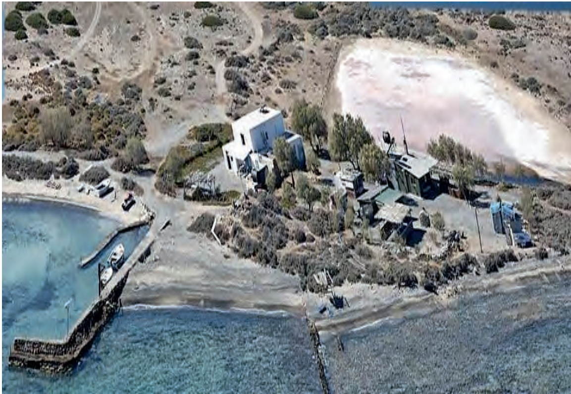
Εικ. 5: Όρμος της Πελεγρίνας στη νησίδα Χρυσή.