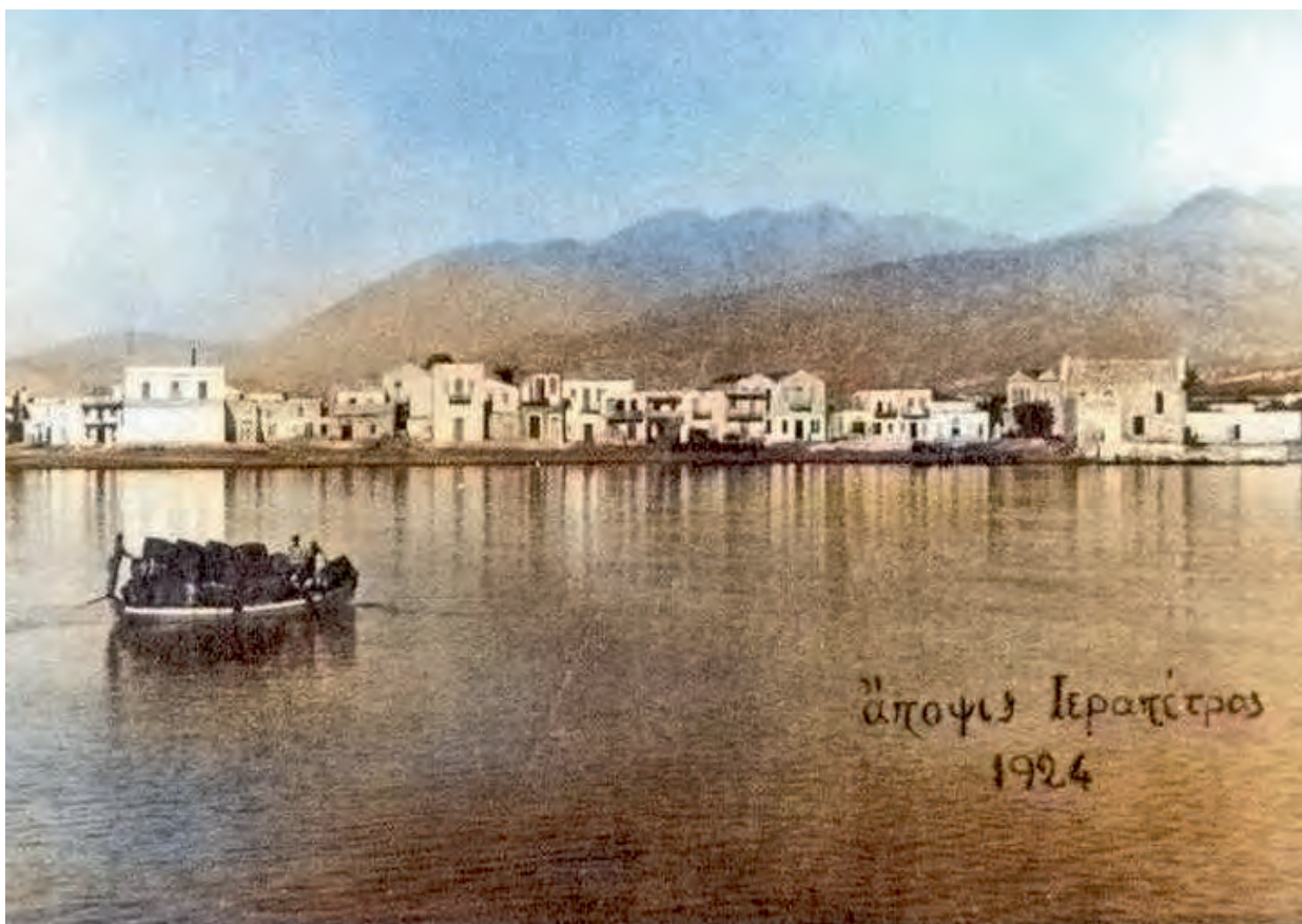
Η Ιεράπετρα το 1924