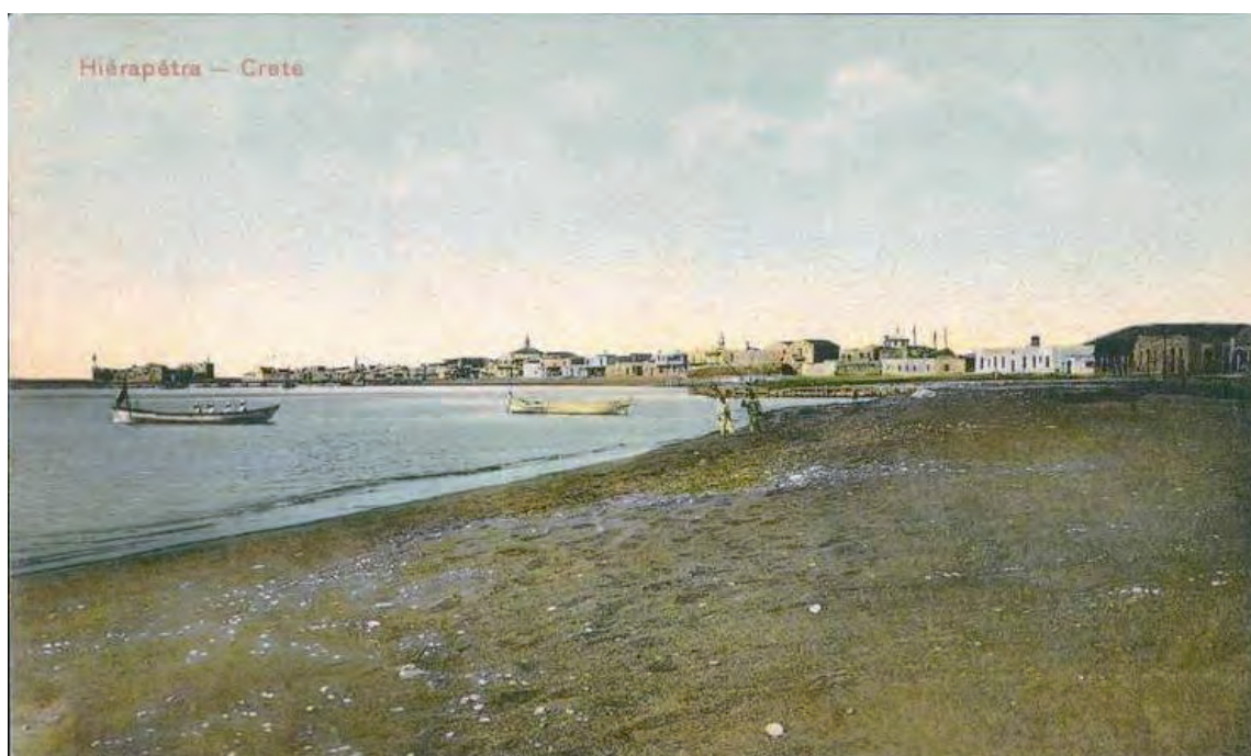
Προκουμαία Ιεράπετρας, 1899