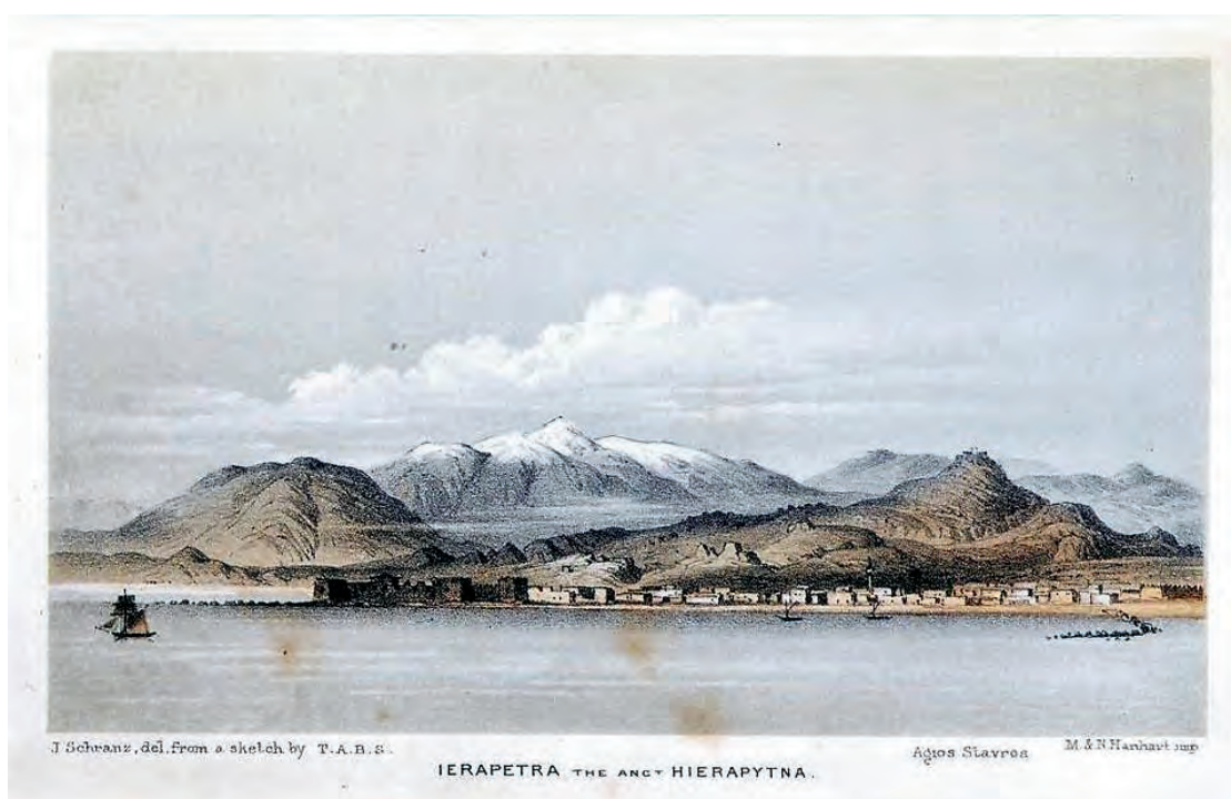
Εικ. 2: Spratt: αποτύπωση του φρουρίου Καλέ με δύο λιμενοβραχίονες.