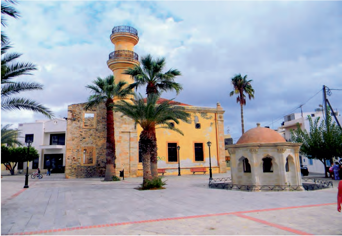
Το τζαμί με την οθωμανική βρύση