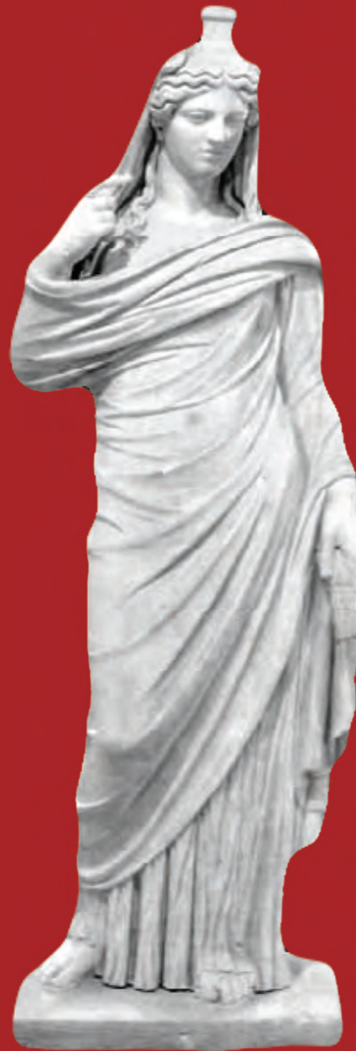
Το άγαλμα της πεπλοφόρου Θεάς Δήμητρας 150–200 μ. Χ. Μόνιμη έκθεση Αρχαιολογικής Συλλογής Ιεράπετρας.