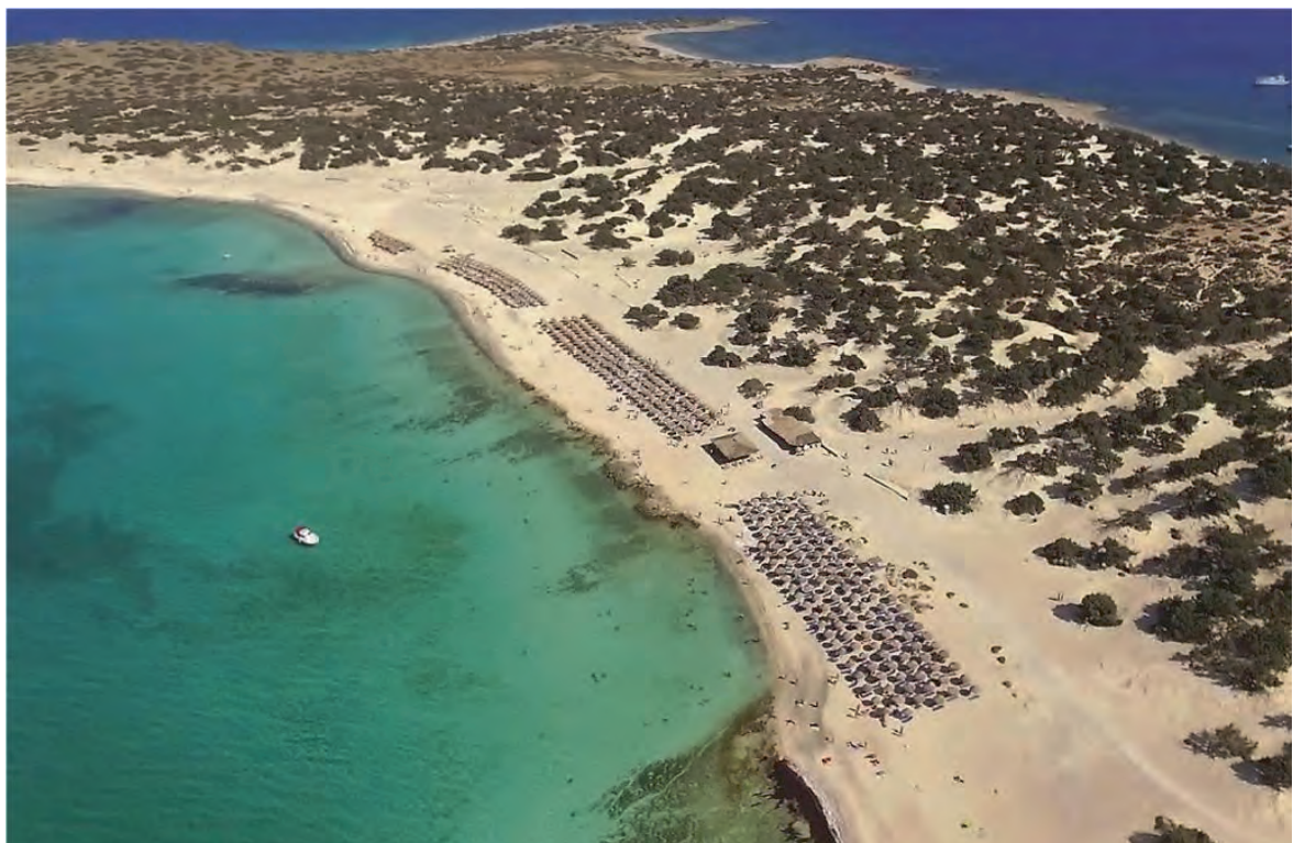
Νήσος Χρυσή ή Γαϊδουρονήσι