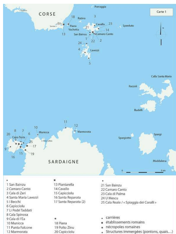
Fig. 3 – Carte de répartition des carrières et des sites romains dans les Bouches de Bonifacio

San Bainzu, où l'équipe des géologues n'a pas pu travailler cette année en raison des conditions météorologiques.