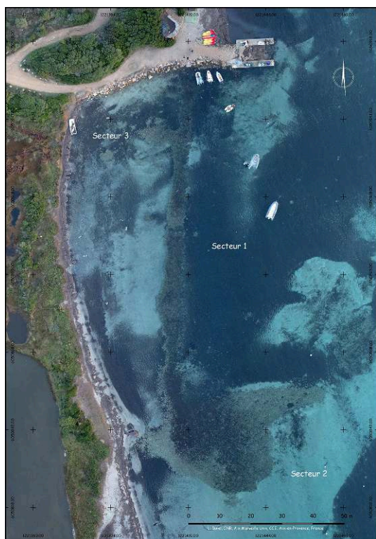
Fig. 2 – Orthophotographie de la structure de la plage de Piantarella