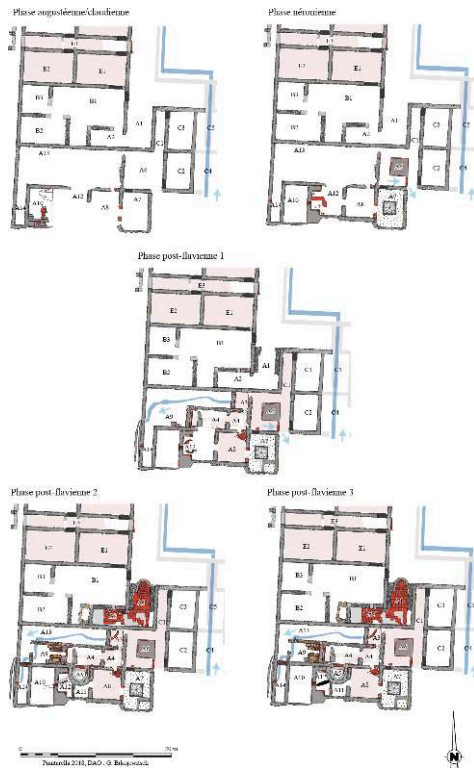
Fig. 1 – Proposition de phasage chronologique des bains de l'établissement de Piantarella

DAO : G. Brkojewitsch (Metz Métropole/CCJ).