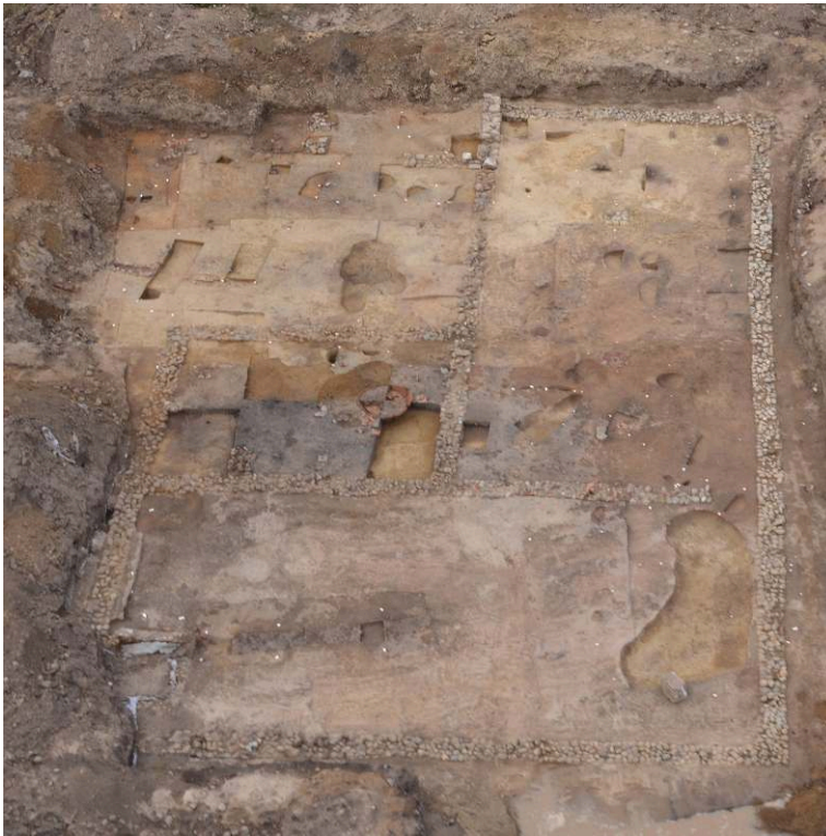
Fig. 2 – Vue générale de la fouille de la villa romaine en 2018