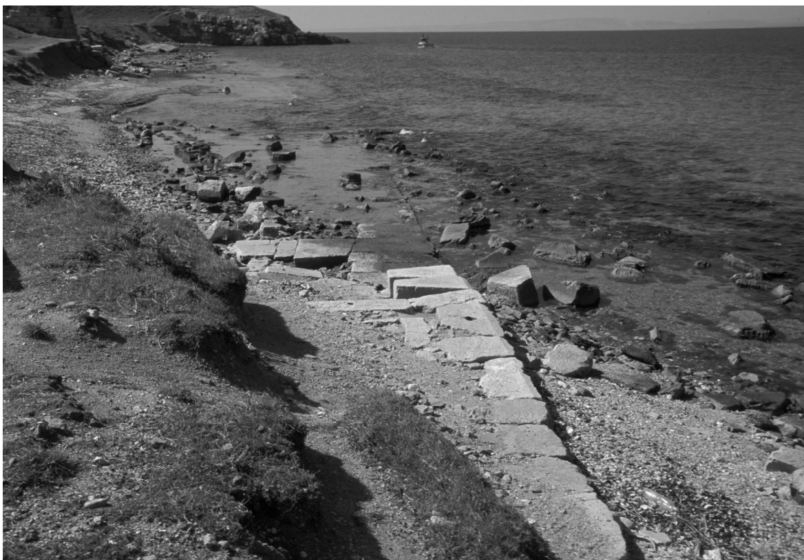
Abb. 9: Parion/Kemer, Kaianlagen des Nordhafens