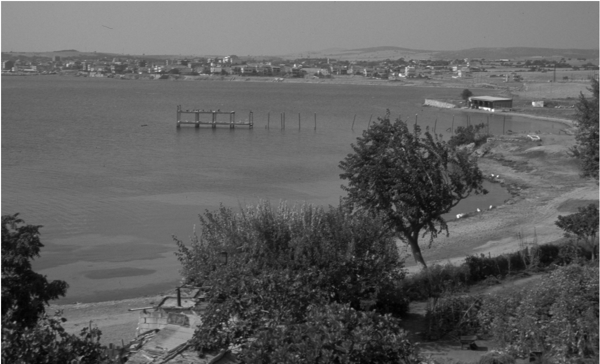
Abb. 11: Pegai/Spiga/Karabiga, Blick auf Hafenbucht