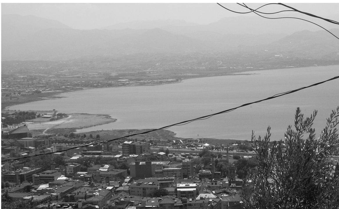
Abb. 18: Nikomēdeia/İzmit, Ende des Golfes