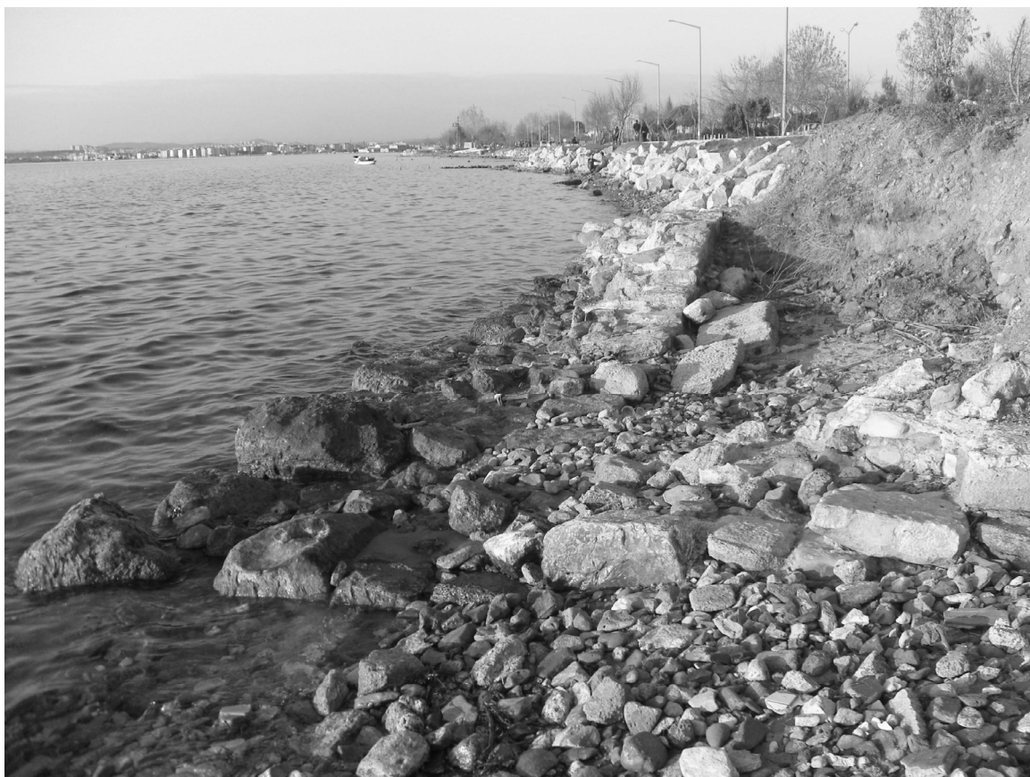
Abb. 5: Pasequia/Kepez, Uferbefestigungen bzw. Kaimauern