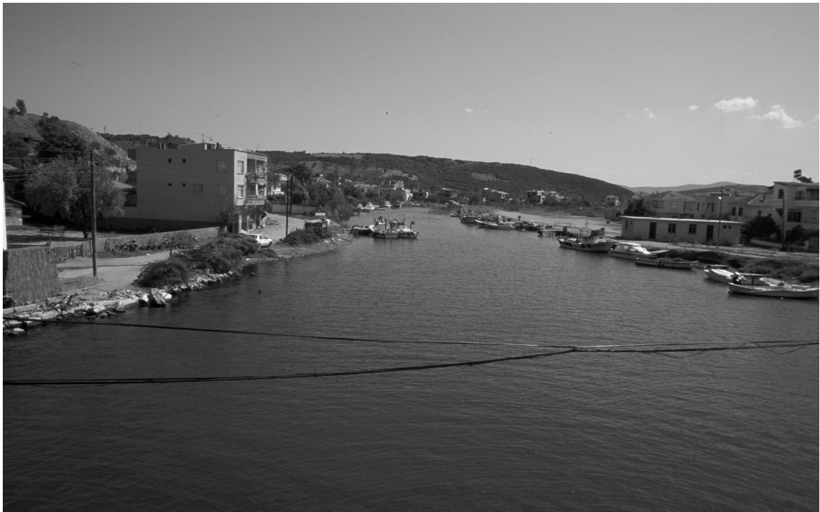
Abb. 7: Parion/Kemer, Flußhafen