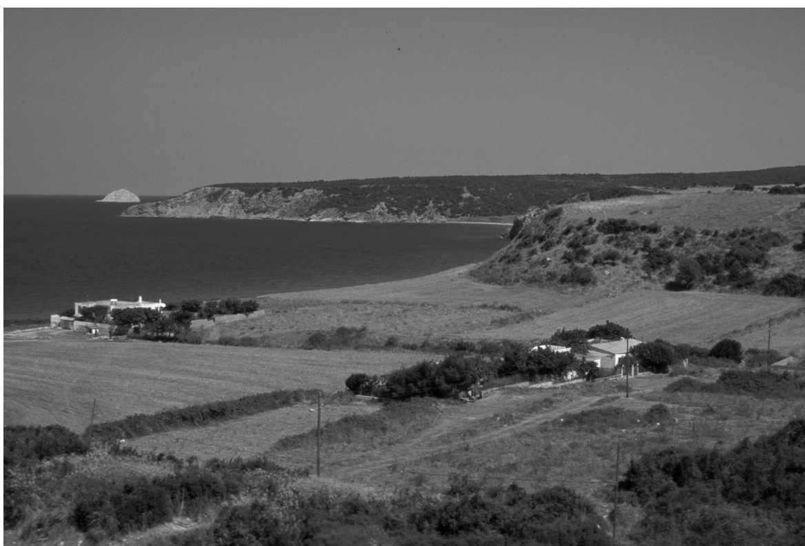
Abb. 6: Parion/Kemer, Bucht des Flußhafens, im Hintergrund Yumurta Adası