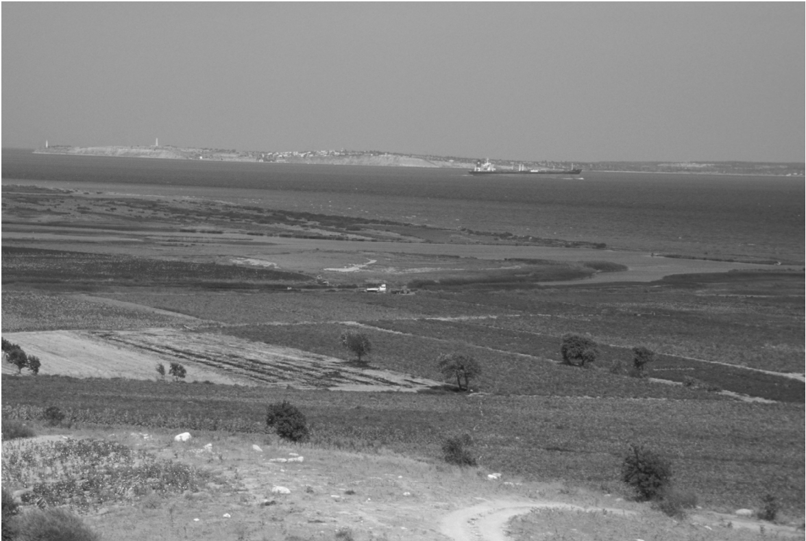
Abb. 3: Trafilo (ö. Mündungsarm des Skamandros/ Küçük Menderes)