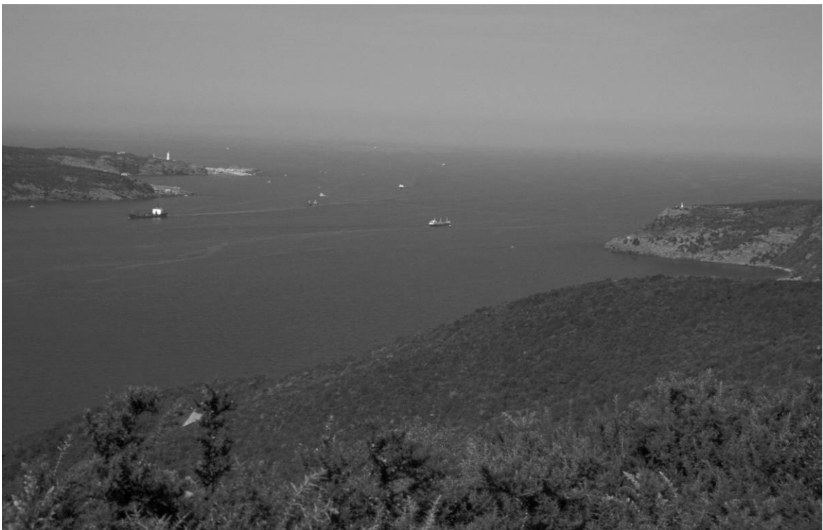
Abb. 20: Hieron/Anadolu Kavağı, Nordausgang des Bosphorus und Schwarzes Meer