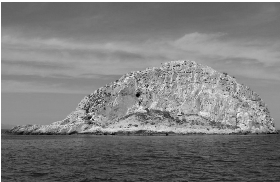
Abb. 13: Augo/Yumurta Adası