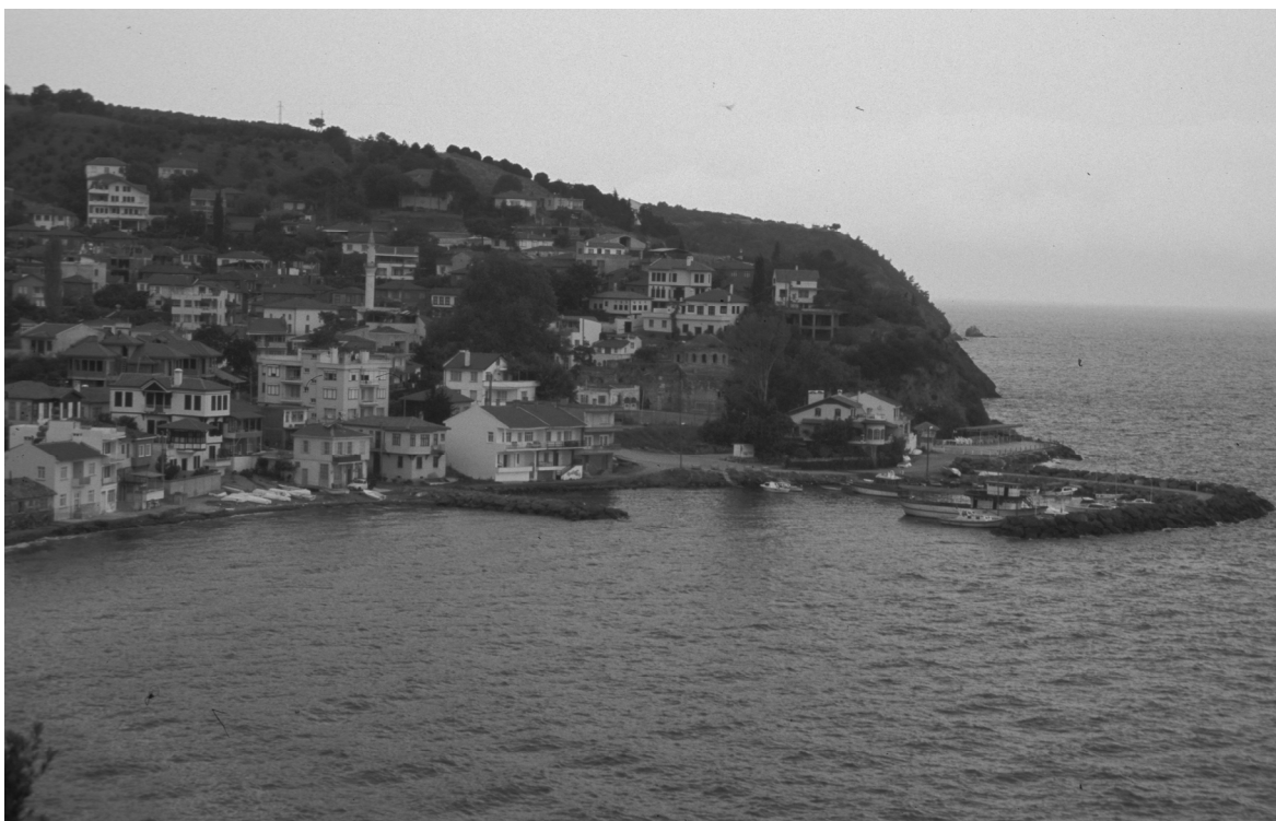
Abb. 17: Sykē/Siğı/Kumyaka, Ort und Hafengebucht