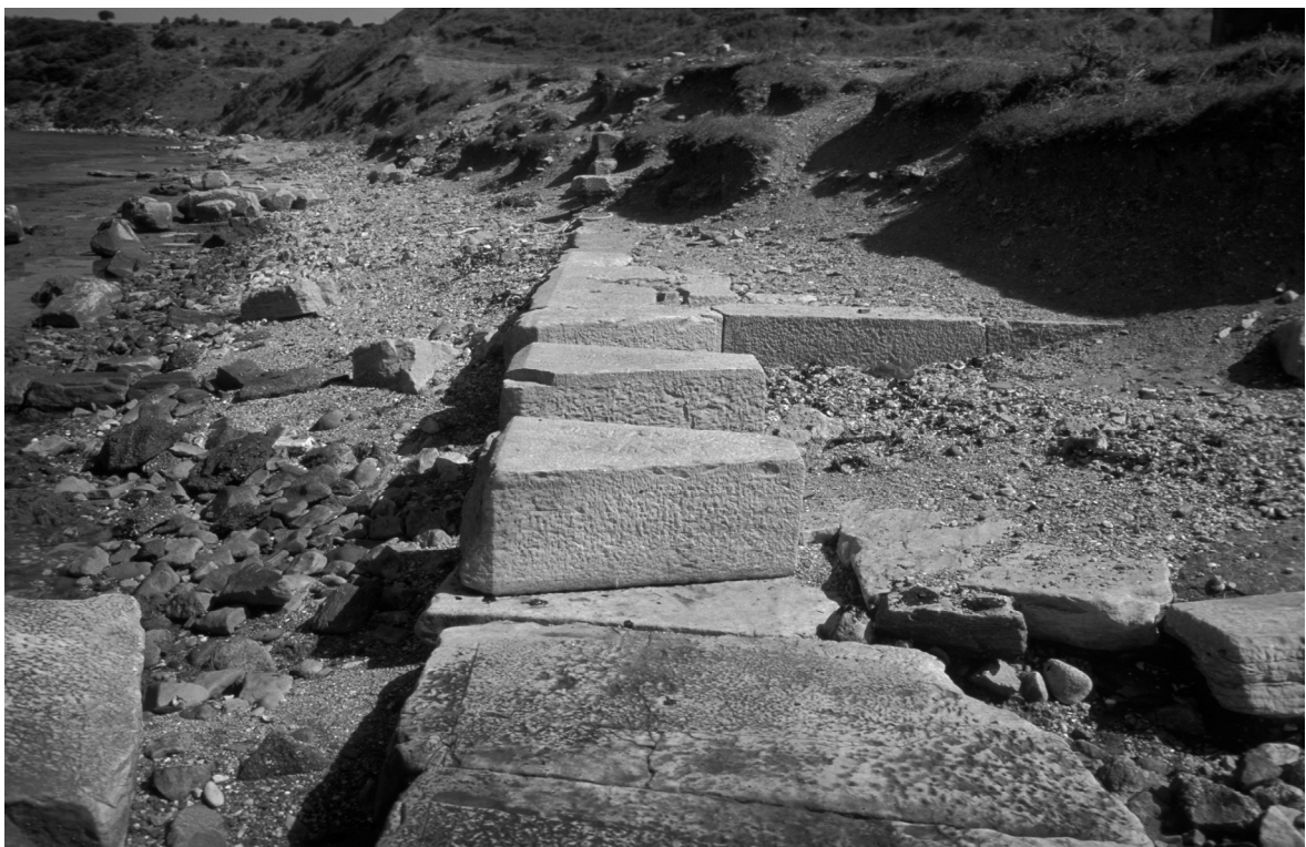
Abb. 8: Parion/Kemer, Kaianlagen des Nordhafens