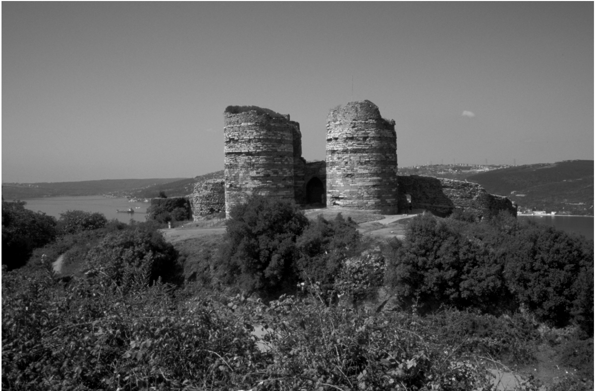
Abb. 19: Hieron/Anadolu Kavağı, Burg (Yoros Kalesi), Torfront