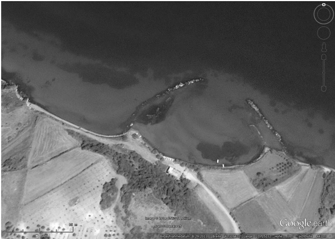
Abb. 15: Şirinçavuş, Hafen (Google Earth)