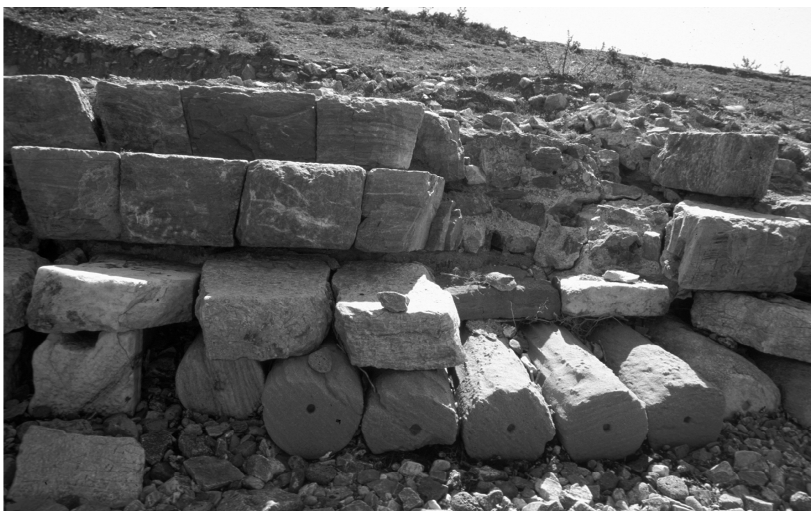
Abb. 10: Parion/Kemer, Uferbefestigung am Nordhafen