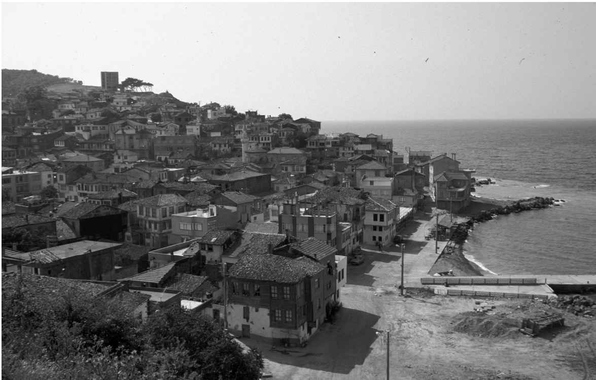
Abb. 16: Trigleia/Trilye/Zeytinbağı, Ort und Hafenbucht