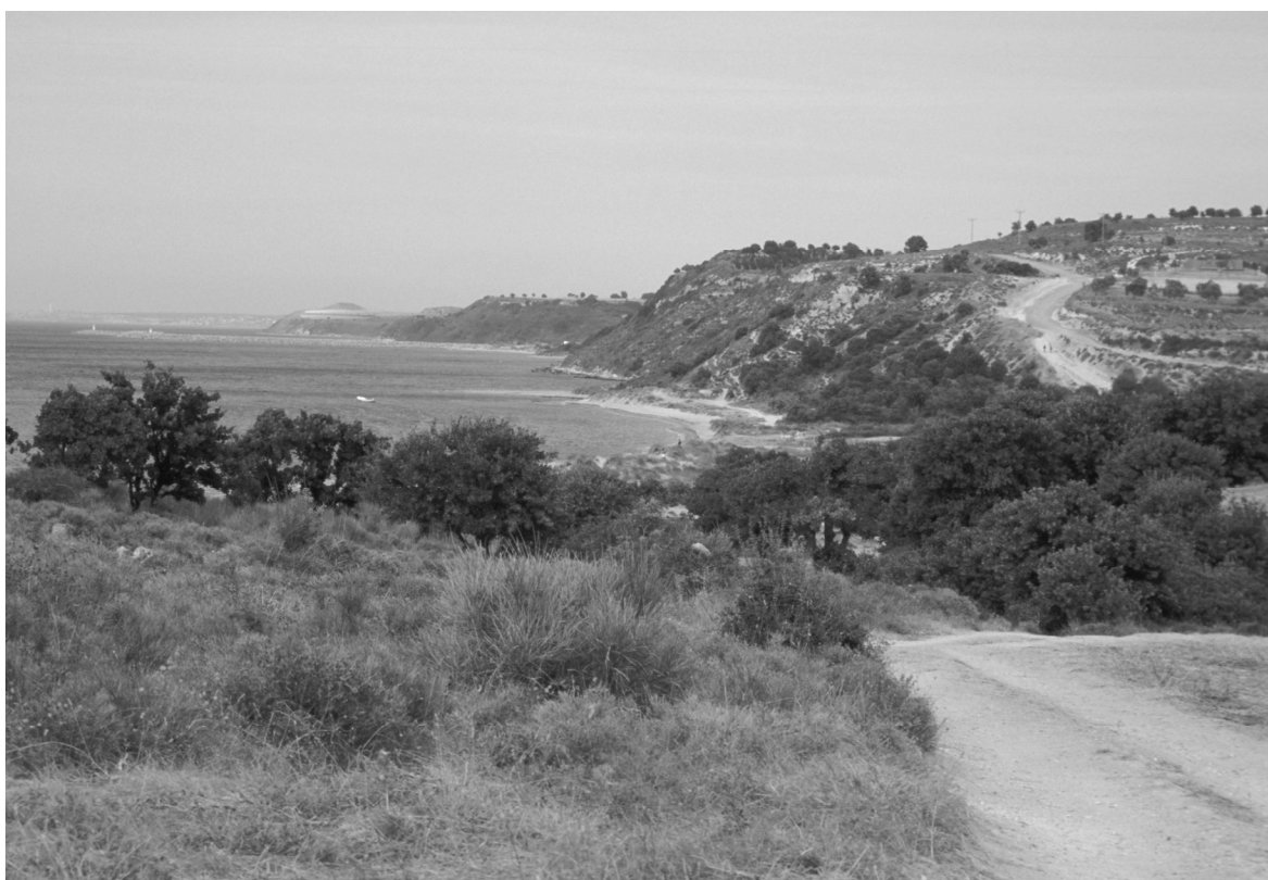
Abb. 2: Gegend von Sermizi (Bucht s. des Beşige Burnu)