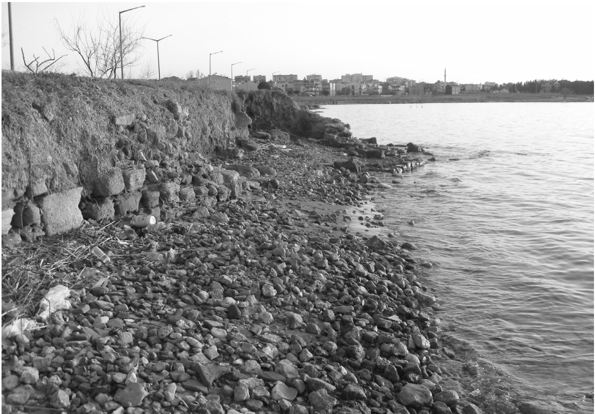
Abb. 4: Pasequia/Kepez, Uferbefestigungen bzw. Kaimauern