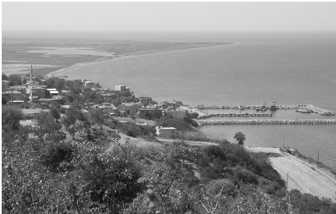
Abb. 14: Blick auf Musakça