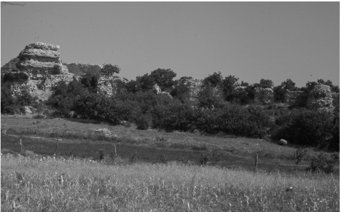
Abb. 12: Pegai/Spiga/Karabiga, Befestigungen von der Landseite