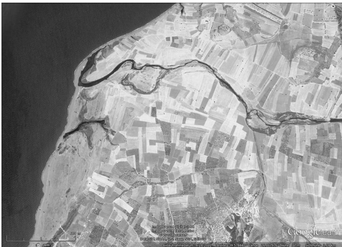
Abb. 1: Scorpiata (Mündungsgebiet des Tuzla Çayı, Google Earth)