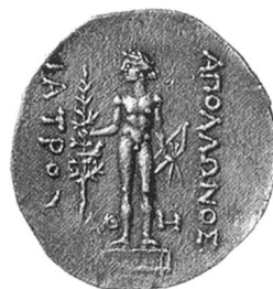
Fig. 4. Tétradrachme en argent d'Apollonia avec l'Apollon de Calamis.

Le témoignage le plus important sur la richesse d'Apollonia dans la première moitié du V e s. réside cependant dans la consécration dans le sanctuaire d'Apollon d'une statue en bronze du dieu, mentionnée par Strabon et qui, d'après Pline ( Hist. Nat. , XXXIV, 18, 39), mesurait 30 coudées (environ 13 mètres) et avait coûté 50 talents. Les Apolloniates en avaient confié la réalisation à Calamis, un des maîtres de l'époque du style sévère, actif dans les années 470-450 av. J.-C. (Moreno 2001). Cette statue colossale, reproduite sur le monnayage de la cité à l'époque hellénistique avec l'inscription ΑΠΟΛΛΩΝΟΣ ΙΑΤΡΟΥ, figurait le dieu entièrement nu, en appui sur la jambe droite, la tête tournée vers sa droite, tenant dans sa main gauche un arc et des flèches et, dans la droite, une grande branche de laurier sur laquelle est posé un oiseau ( fig. 4 ) 24 . L'attitude d'ensemble est celle de statues en marbre appartenant aux types dits de l'Apollon à l'omphalos et de l'Apollon Choiseul-Gouffier 25 , répliques d'un original du style sévère qui, s'il ne s'agit pas de la statue d'Apollonia, devait en être très proche. L'offrande spectaculaire de l'Apollon de Calamis marque en tout cas l'aboutissement d'une évolution politique et économique très favorable que les découvertes archéologiques ne laissent actuellement qu'entrevoir.