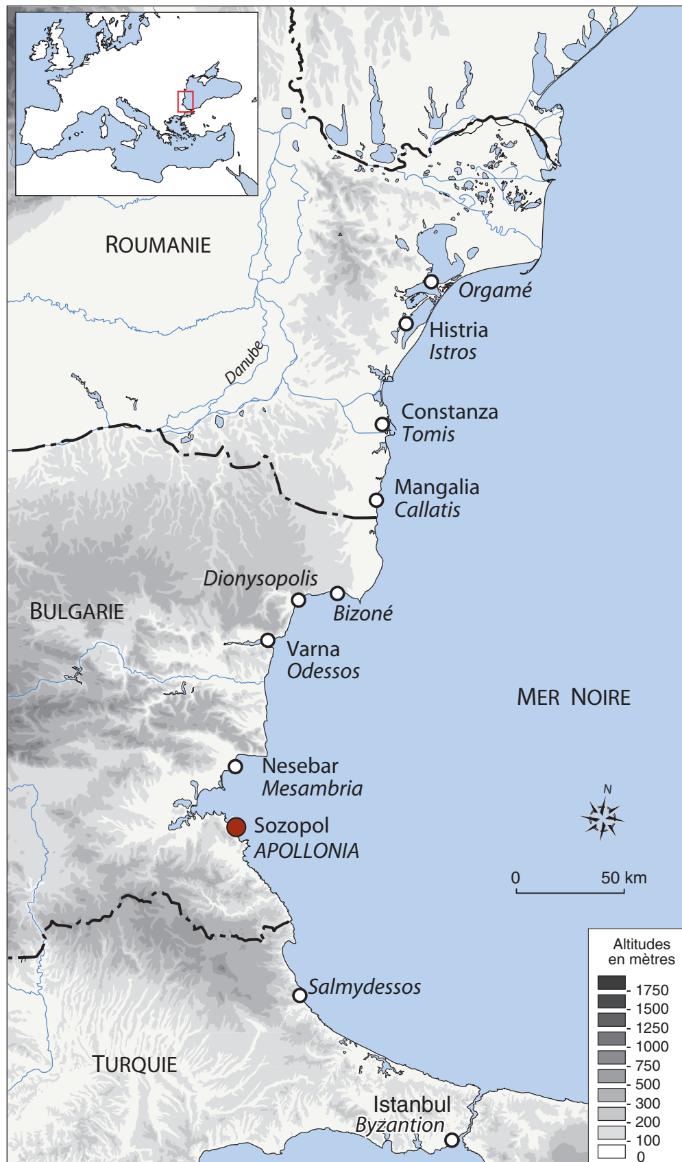
Fig. 1. Les colonies grecques du littoral occidental de la mer Noire. Les noms antiques sont en italiques (DAO P. Pentsch).