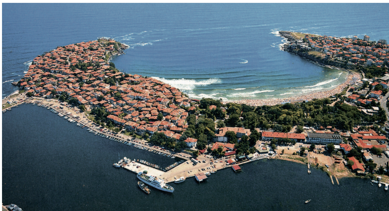
Fig. 2. La péninsule de Skamni, site principal de la ville antique.

établissements des côtes Nord et Nord-Ouest (Istros, Orgamé, Berezan et Olbia) 7 .