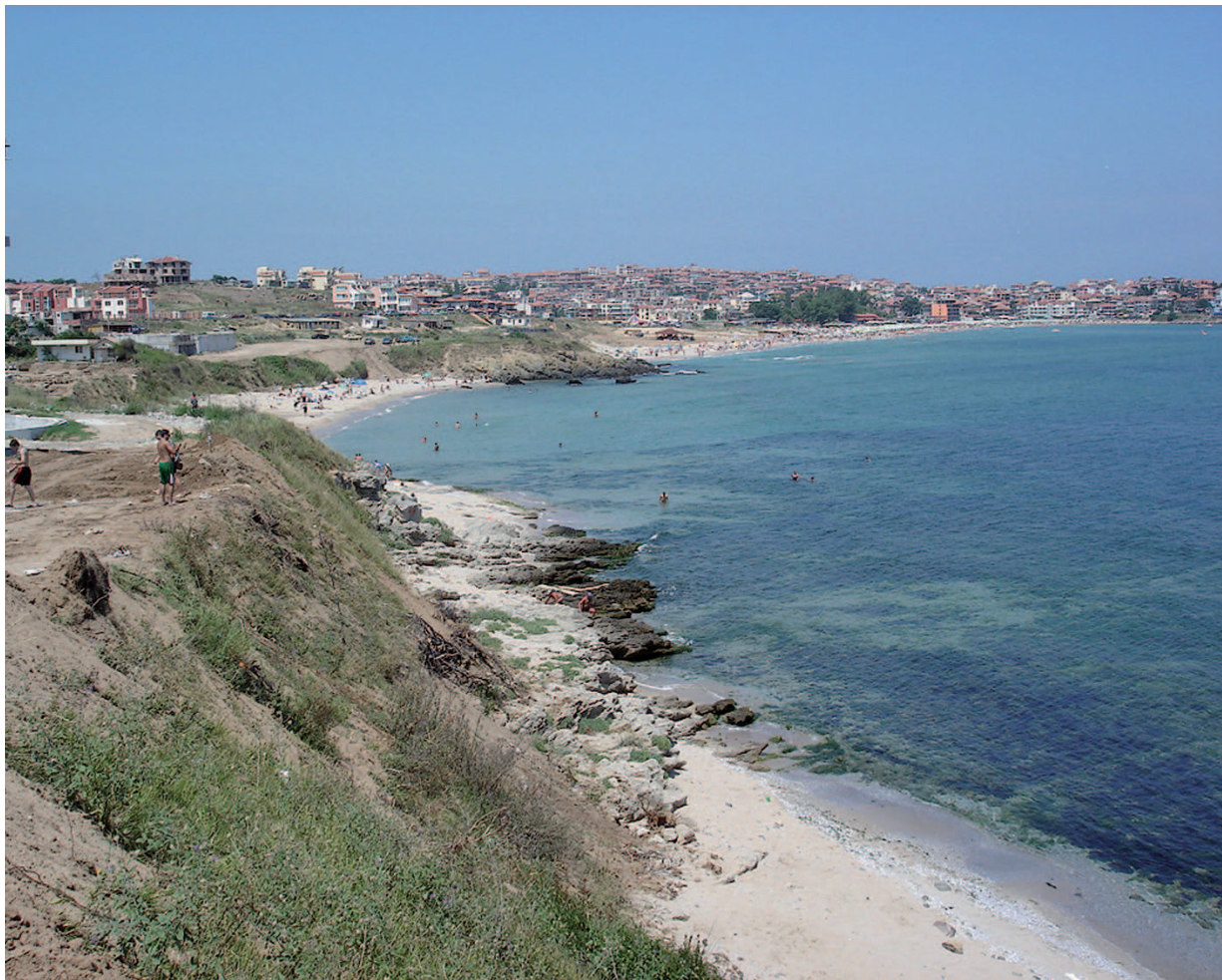
Vue, depuis Boudjaka, sur Kalfata, le quartier de Harmanité et la ville de Sozopol.