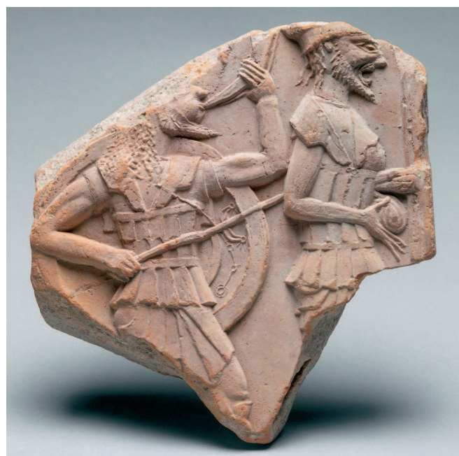
Fig. 3. Relief architectural en terre cuite provenant des fouilles de Degrand à Sv. Kirik. Paris, Louvre, CA 1748.