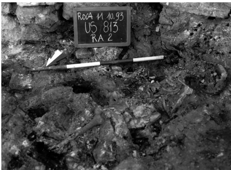
120. Roca. Porta Monumentale.

Veduta da NordOvest della porzione indagata del Vano Sud.