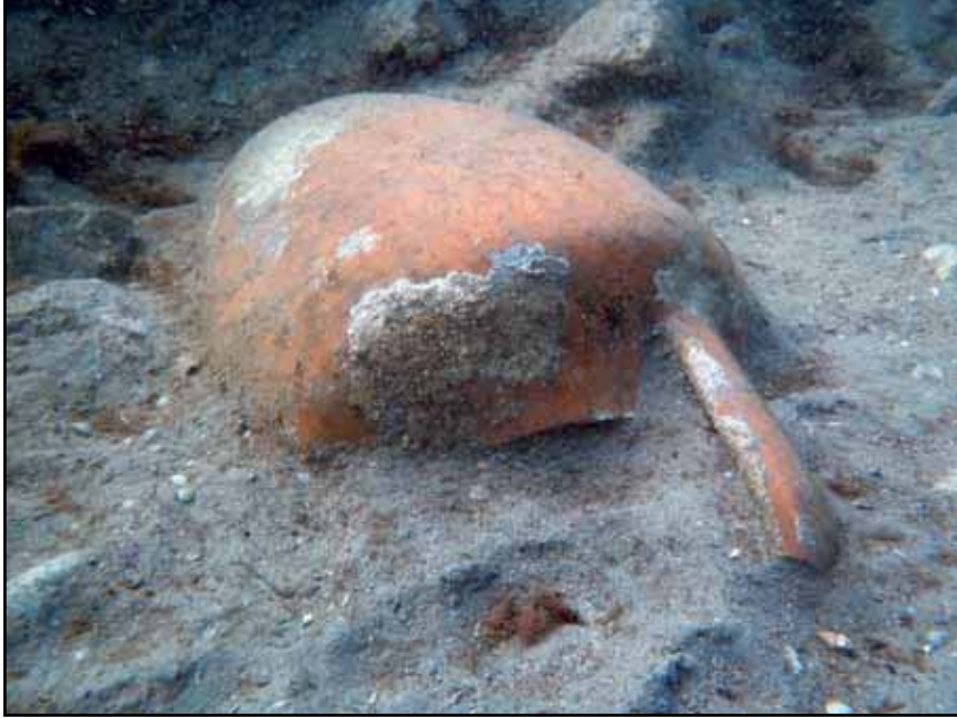
Resim 2: Liman Tepe / Klazomenai sualtı kazılarında açığa çıkarılan bir amphora.