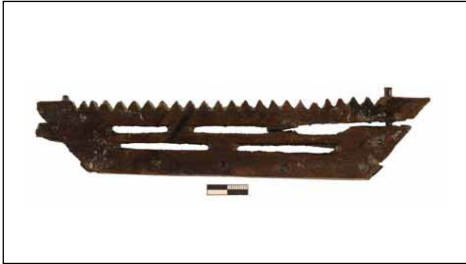
Resim 8: Liman Tepe / Klazomenai sualtı kazılarında ele geçirilen M.Ö. 4. yy.a ait geçmeli bir ahşap parçası.