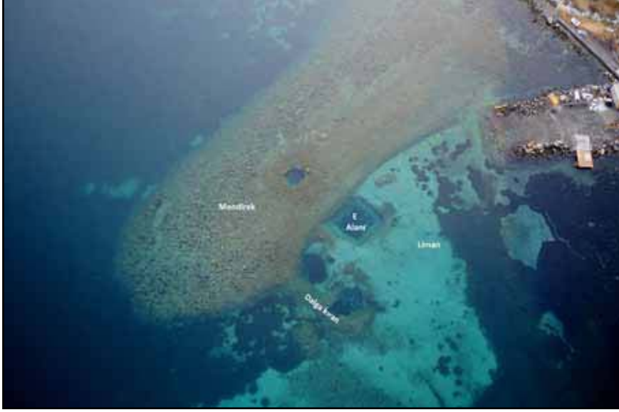
Resim 1: Liman Tepe Mendirek yapısı ve su altındaki kazı alanları.