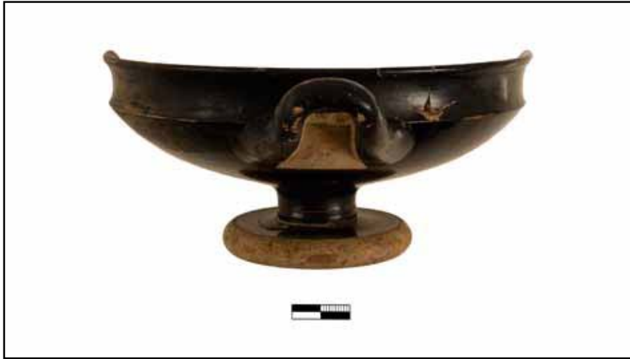
Resim 6: Liman Tepe / Klazomenai sualtı kazılarında ele geçirilen M.Ö. 4. yy.a ait bir seramik örneği.