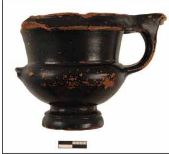
Resim 4: Liman Tepe / Klazomenai sualtı kazılarında ele geçirilen M.Ö. 4. yy.a ait bir seramik örneği.