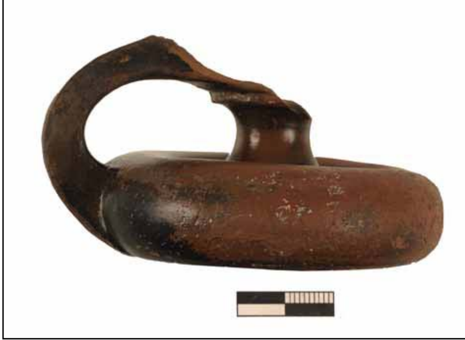
Resim 5: Liman Tepe / Klazomenai sualtı kazılarında ele geçirilen M.Ö. 4. yy.a ait bir seramik örneği.