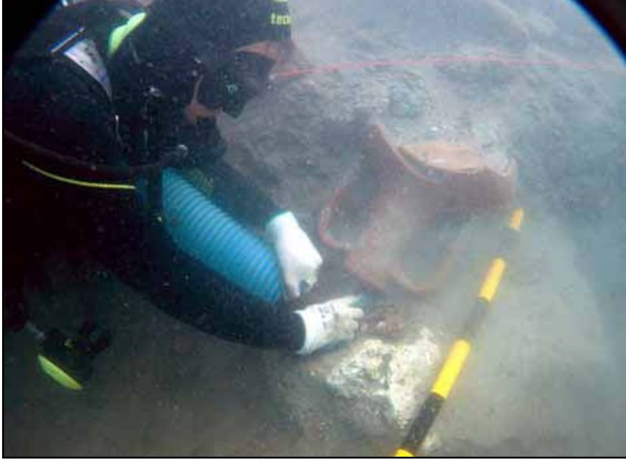
Resim 3: Liman Tepe / Klazomenai sualtı kazılarında açığa çıkarılan bir amphora.