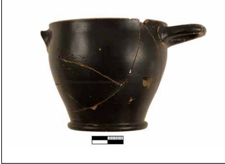
Resim 7: Liman Tepe / Klazomenai sualtı kazılarında ele geçirilen M.Ö. 4. yy.a ait bir seramik örneği.