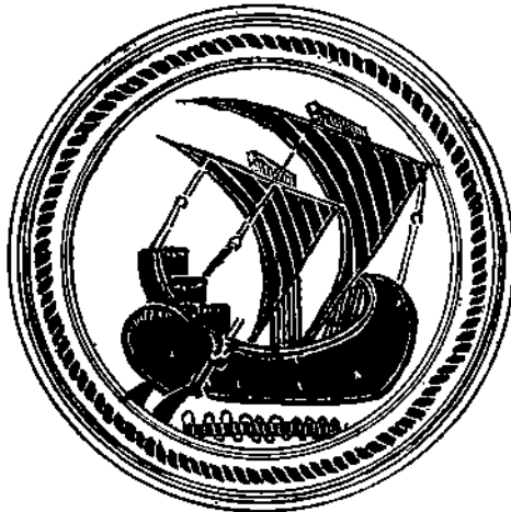
D'après un plat byzantin du XIII e siècle (Musée de Corinthe)