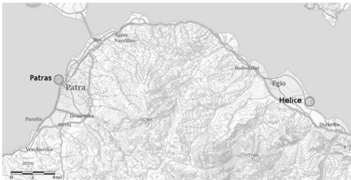
Figura 33: Ubicación de los puertos de Acaya nombrados en el Catálogo.