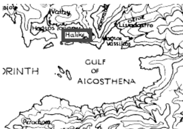
Figura 20: Sifas, el puerto (actual Halike/Alyki). Imagen modificada a partir de Heurtley, W.A. (1923/1925).

El de Sifas fue un asentamiento de la Beocia meridional, en la costa del Golfo de Corinto ( Fig.1820 ).