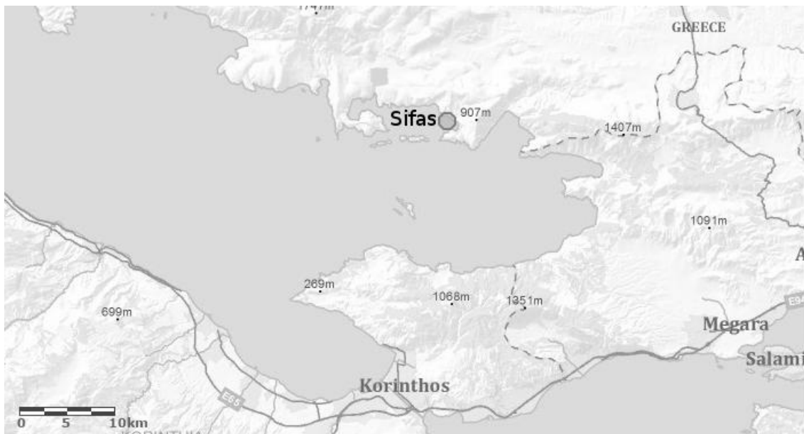
Figura 1: Puertos de la parte meridional de la Beocia nombrados en el Catálogo. Imagen de la autora (imagen modificada sobre la base del mapa topográfico de ArcGis).