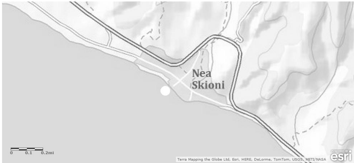
Figura 105: Posible posición del puerto antiguo de Escíone. Mapa topográfico de ArcGis.

El puerto de Escíone resultó activo sobre todo como punto de embarque de los cargamentos de vino de la Calcídica destinados al Mar Negro.