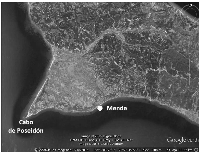
Figura 104: Posición del puerto de Mende, foto de satélite. Imagen de Google Earth modificada por la autora.

trigo que después transportaban a Atenas 4 .