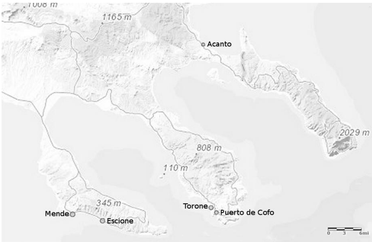
Figura 103: Posición de los puertos nombrados en el Catálogo. Imagen de la autora (imagen modificada sobre la base del mapa topográfico de ArcGis).