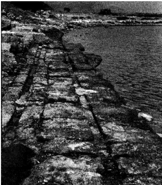
Figura 97: Antedon, foto del embarcadero SO. Bass, G. (1972).