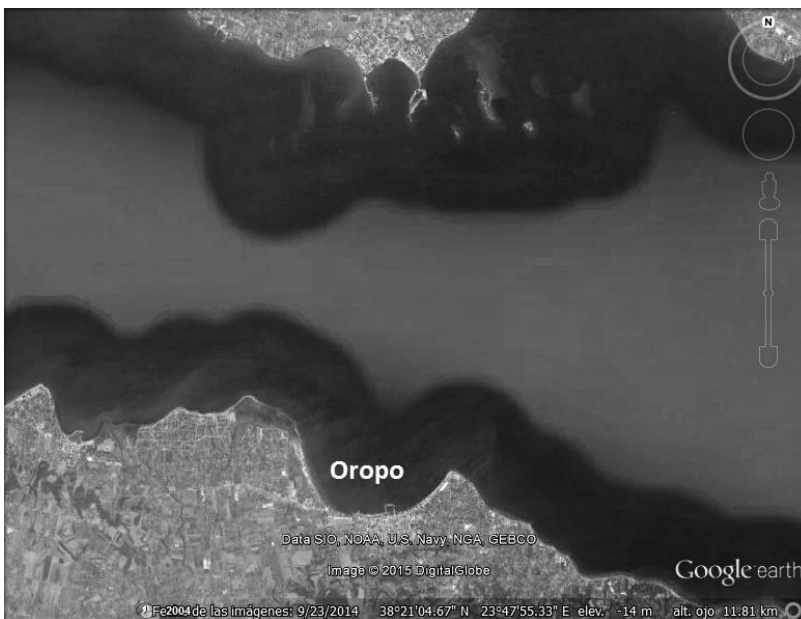
Figura 95: Localización del puerto de Oropo. En la costa eubea, directamente en el Norte de Oropo, se situaba el puerto de Eretria. Imagen de Google Earth modificada por la autora.

El asentamiento de Oropo se encontraba en el confín entre Ática y Beocia, por lo que a menudo fue objeto de disputas 1 . Su puerto, conocido en épocas sucesivas también con el nombre de Delfinion , se encuadraba en un área entre dos promontorios en la desembocadura del río Asopo (actual Vouríeni). La presencia de la isla de Eubea, que sigue en este tramo la costa del Peloponeso, contribuía a la creación de un golfo (Notios Evoikos Kolpos) bastante resguardado de las dinámicas marítimas.