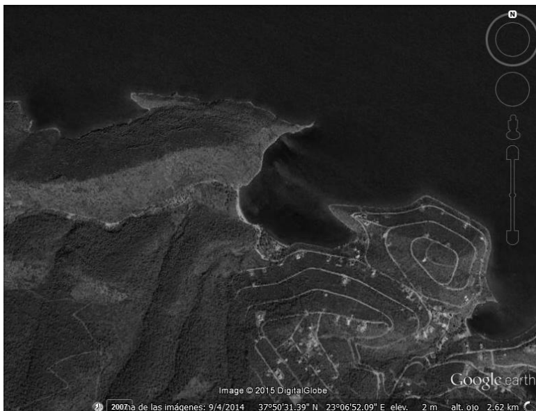
Figura 61: Particular de la ubicación del puerto de Espireo, situado entre dos promontorios.

Tal identidad se vería confirmada por la correspondencia geomorfológica entre el relato del historiador y la costa alrededor de Frangolimano 3 .