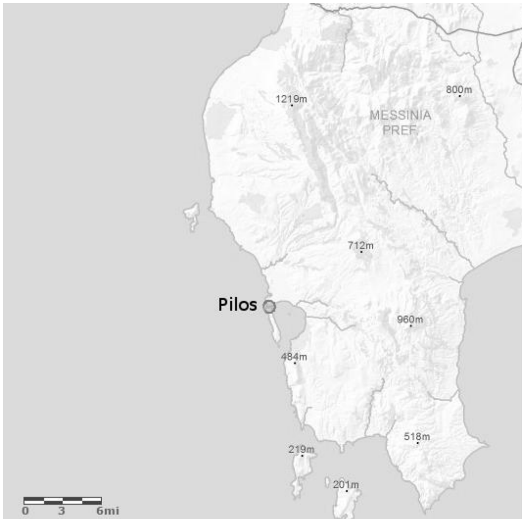
Figura 401: Mapa de Mesenia con ubicación del puerto de Pilos. Imagen de la autora (imagen modificada sobre la base del mapa topográfico de ArcGis).